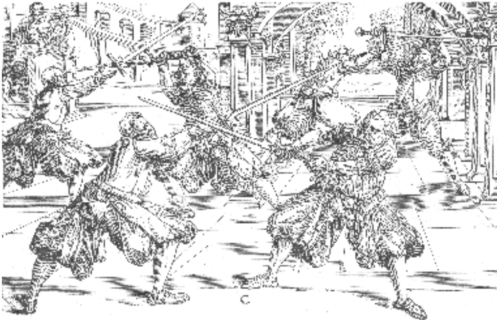
Fechten mit dem Ringtschwert.

Gefochten wurde stets barhäuptig, sehr oft mit abgelegten Oberkleidern; die einzige Schutzwehr war die Waffe selbst, und unzählige Kniffe und Pfiffe finden wir in den alten Fechtbüchern zum Angriff, zur Auslage und Abwehr angegeben. „Alber“, „Ochs“, „Tag“ und „Pflug“ heißen seltsamer Weise die verschiedenen Auslagen (Leger). Von Hieben nennen wir den Ober- und Unter-, den Mittel- und Flügelhau. Für besonders subtil galten der Zorn- und Krummhau, sowie der Zwerg- und Scheitelhau. Eine Hauptparade beim langen Schwert, der imposanten Stellung halber vielfach als Titel vignette abgebildet, war die sogenannte